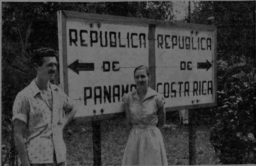
Durante una visita a la frontera Sur, la señora de Salas, maestra de la Escuela Central de Golfito, departe amigablemente a través de la línea fronteriza, con un compañero de trabajo de la Chiriquí Land Company.