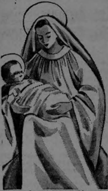
En el portal de Belén hay un nido de ratones...

La copla que viene en el aire en esta noche aromada a ciprés, manzanas e incienso se pierde enredada entre los dedos plásticos del viento frío... Cuatro jovencitos raposos cantan bajo un árbol desdibujado por la tarde parlácea que cabecea sabrosamente sobre un almídon de nubes blancas que se visten de púrpura en la hora crepuscular.