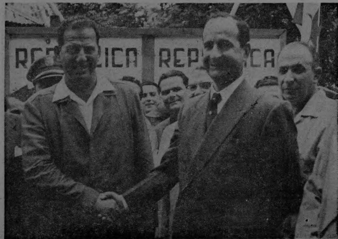
El Presidente Figueres de Costa Rica y el Presidente Arias de Panamá, se estrechan sonriendo la mano durante la entrevista que sostuvieron en el punto fronterizo de Puerto González Viquez.