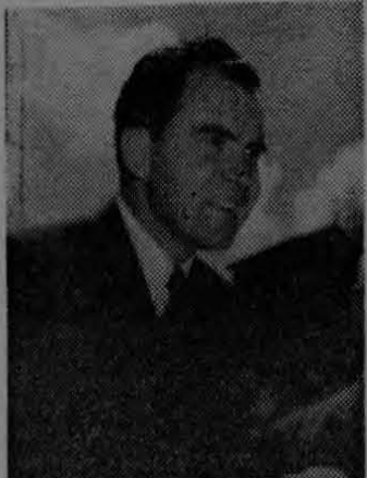
El Vicepresidente de los Estados Unidos de América, Sr. Richard M. Nixon, visitó la zona bananera de Costa Rica.

Bella ilustración de una tarde en Boca Vieja de Quepos, aparece en