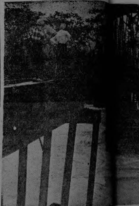
Tremendas inundaciones, que especialmente la Zona Sur, azotaron al país el pasado octubre de los puentes dañados en la zona bananera.