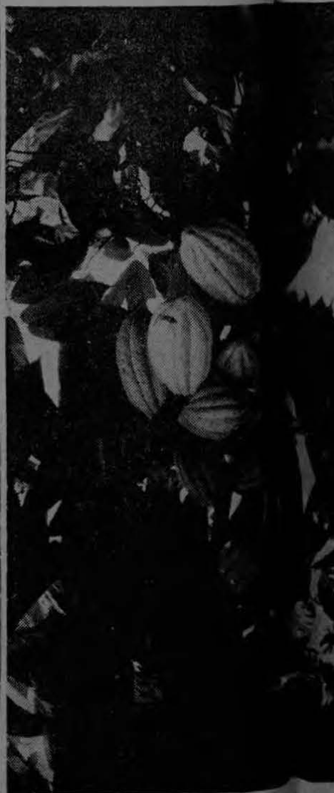
La Compañía Bananera da eficacia al cacao en el país, para lo cual coopera con la semilla de plantas como ésta.